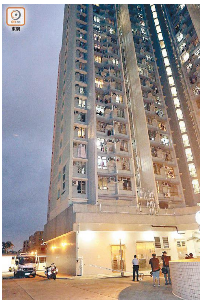
男童在四樓單位墮樓。

墮樓男童姓譚，與父母、外婆及兄長，一家五口同住鯉魚門邨鯉興樓四樓一單位。據悉，男童與母同睡一房，其父則分房獨睡一張三呎床。事發時男童父母正外出上班，其兄則落樓玩滑板車，僅剩他與外婆在家。