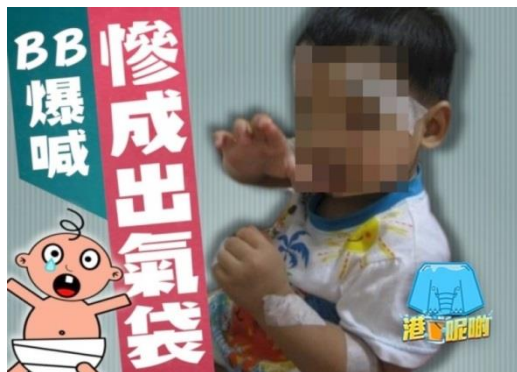
不少家長對於小朋友「扭計」都感到束手無策，甚至會將情緒發洩在他們身上。圖為台灣一宗家暴案的受虐兒童。(設計圖片)