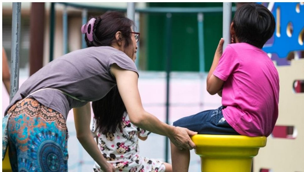
有八成半受訪者表示過去一年因疫情而增加管教孩子的壓力。

疫下學童因停課容易影響學習進度，有特殊學習需要的兒童更甚。防止虐待兒童會於 2020 年 12 月至 2021 年 2 月期間，以問卷形式訪問 145 名家長，了解特殊學習需要兒童及其照顧者的需要，當中有 121 名家長的孩子正等候評估或已評估為有特殊學習需要。結果顯示，有八成半受訪者表示過去一年因疫情而增加管教孩子的壓力；在等待評估或已評估組群的家長中，超過四成家長（52 人）表示當與孩子發生衝突時，會以打罵方式處理，可見體罰的情況普遍。